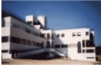
TH 556 Edificio para convertir a hotel en Guadalajara