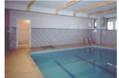
TH 493 Hotel a pie de pistas de esquí en los Pirineos

Más de 200 hoteles en venta en España, entre edificios y solares para uso hotelero y hoteles en funcionamiento