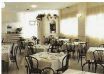
TH 556 Edificio para convertir a hotel en Guadalajara

TH 494 Hotel 3 estrellas de 32 habitaciones ampliables a 49 en Ejea de los Caballeros (Zaragoza) 1.150.000 Euros (192 M. Ptas.)