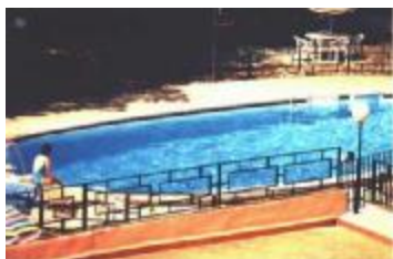
TH 538 Pequeño hotel a reformar en provincia de Valencia

TH 454 Edificio para oficinas con 10.000 m. sobre rasante en el centro de Valencia 6.626.000 Euros (1.100 M.