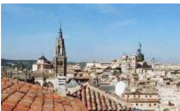
TH 546 Hotel en centro histórico de Toledo