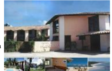
TH 547 Pequeño hotel en Brasil

TH 466 Terreno uso hotelero en Almuñecar (Granada) para hotel 200 habitaciones. Para venta, cesión o permuta.