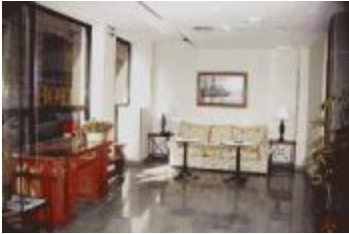
TH 546 Hotel en centro histórico de Toledo

habitaciones en funcionamiento en centro de Alicante 7.212.000 Euros (1.200 M. Ptas.)