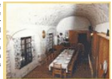
TH 469 Centro de turismo a reformar en provincia de Alicante

Para recibir mayor información llame al 93 362 37 00 o bien escriba a info@todohotel.com y le atenderemos a la mayor brevedad