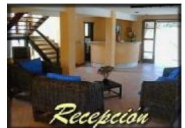
TH 547 Pequeño hotel en Brasil