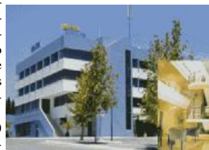
TH 550 Hotel en venta en Lisboa

de datos propia con las 900 empresas propietarias de todos los hoteles de España y otros profesionales responsables directos de las compras inmobiliarias en el sector, direcciones entre las que se encuentra la suya. Si no desea recibir de nuevo este informe o bien piensa en otra persona a quién le pudiera interesar más, comuníquenoslo y se lo haremos llegar.