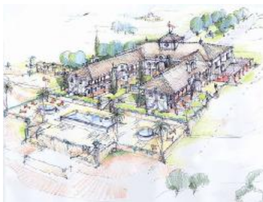
TH 543 Proyecto para hotel de 64 habitaciones en Marbella

pueda elegir entre las distintas opciones la que más se adapta a sus necesidades. Inmediatamente después de la aceptación de los contratos iniciaremos la actividad hasta conseguir la venta o cesión de su inmueble.