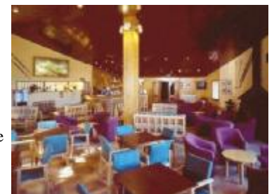
TH 493 Hotel a pie de pistas de esquí en los Pirineos

Más de 200 hoteles en venta en España, entre edificios y solares para uso hotelero y hoteles en funcionamiento