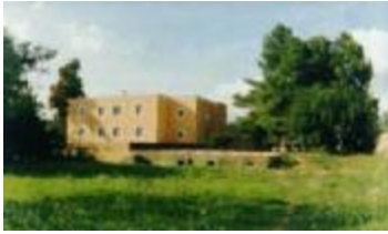
TH 538 Pequeño hotel a reformar en provincia de Valencia

TH 542 Edificio céntrico para hotel de 30 habitaciones en Barcelona 2.524.000 Euros ( 420 M. Ptas.)